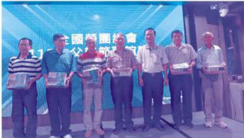
感恩辛苦的爸爸，在福華大飯店舉辦「父親節聯誼活動」，全國勞團總會精心挑選台糖養生雞湯給每位男性幹部。