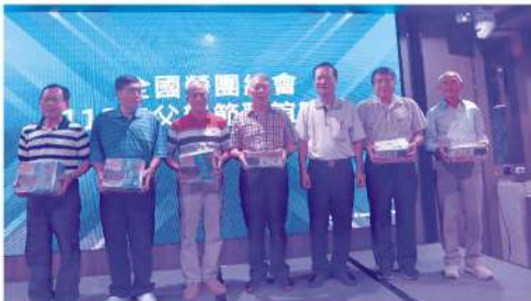
感恩辛苦的爸爸，在福華大飯店舉辦「父親節聯誼活動」，全國勞團總會精心挑選台糖養生雞湯給每位男性幹部。