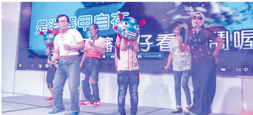
幹部們歡樂帶動歌中劇結合功夫基本動作以樸實的鑼鼓帶領步伐模仿弄獅唯妙唯肖。