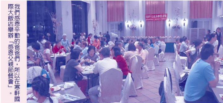
我們感恩辛勞的爸爸們，所以在寒軒國際大飯店舉辦「感恩父親節餐會」。