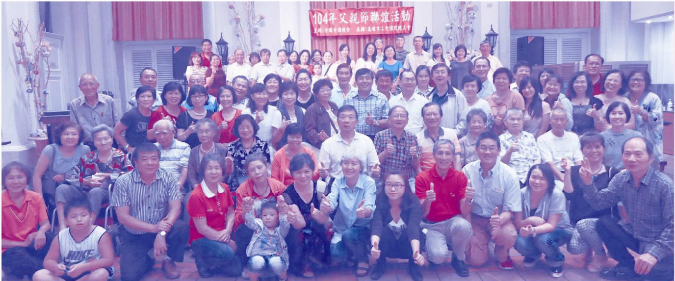
融洽的氣氛、歡樂的笑臉，這就是我們這個大家庭。