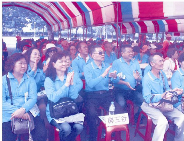
勞工社創社至今已榮獲不少獎項：業務競賽、社員成長等，所有榮耀皆屬全體社員，感謝社員們的支持鼓勵。