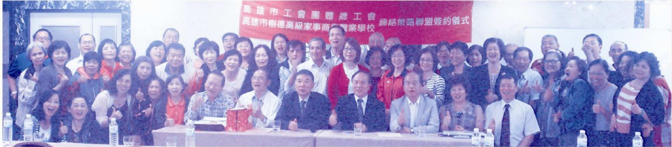
全體與會人員在溫馨愉快的氣氛下共同見證締結簽約，並歡喜留念合影為儀式畫下完美句點。