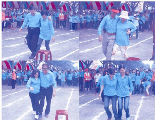
「勞工社員們在「二人三腳」項目中展現「團結同心，攜手共創美好未來」的精神，積極為社爭取榮耀。」