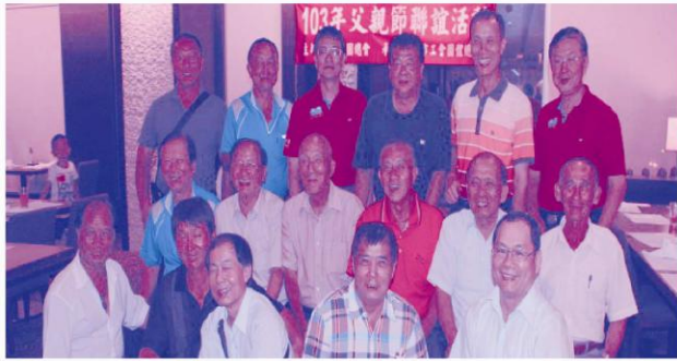
爸爸您就像大樹守護整個家，感謝您默默的付出，我們永遠愛您！勞團總會男性幹部一同合影。