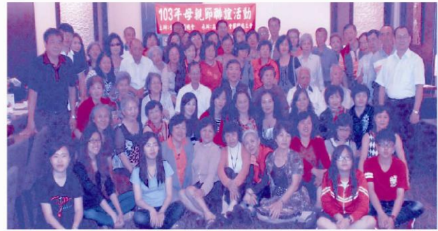
歡樂一家親，讓我們一同感謝偉大，無私奉獻給家庭的媽媽們，「全國勞團總會」家庭聚會溫馨合影。