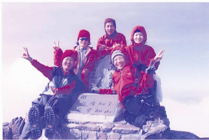
透過登山開闊視野，除了與山友們獲得許多經歷與成長，也讓自己體驗山的寧靜與用心愛山，而得到不一樣的人生啟發。因為登山活動是享受大自然奧妙，是興趣與健身，而不是挑戰與攻頂。