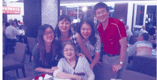
「世上只有媽媽好！」媽媽您是我們的寶，願您平安、健康，有您真好！及時行孝，愛要說出來。