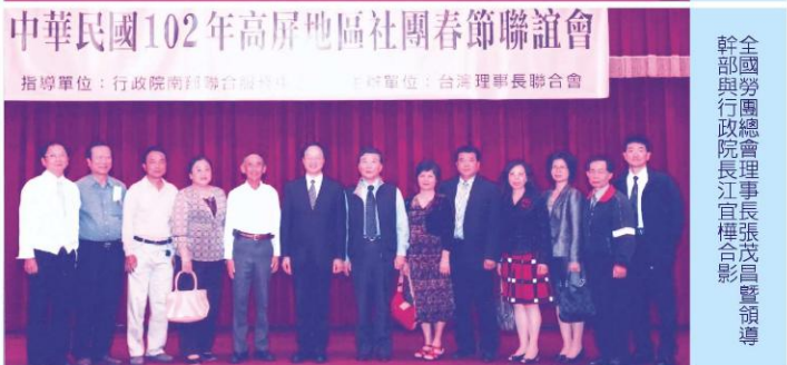
全國勞團總會理事長張茂昌暨領導幹部與行政院長江宜樞合影