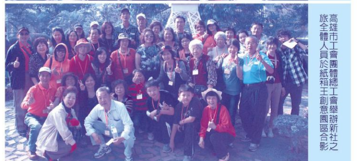
高屏地區各工會團體總工會舉辦新春聯誼會全體人員於紙箱王創意園區合影