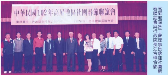
高屏地區各工會理事長參加社團新春聯誼會與行政院長江宜樞合影