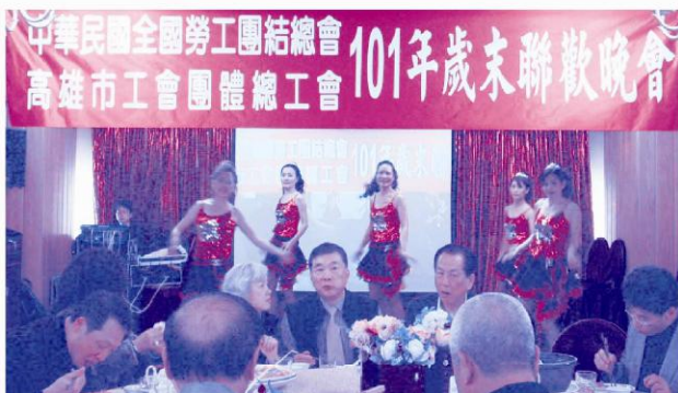
財團法人廣東同鄉會樂悅律動團精湛的舞蹈表演，舞孃活力四射充滿自信、展現性感魅力，獲得全場喝采。