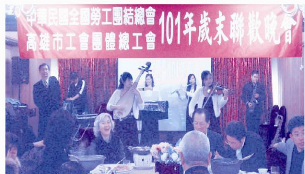
天鳳樂團老師融合東西方樂器演奏經典老歌，讓大家陶醉在雄壯、溫柔、輕快、活潑音樂中。