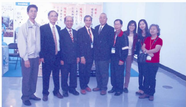
幹部及會務人員皆以組織為榮，若認同我們的理念歡迎加入我們的行列，為社會盡最大的責任。