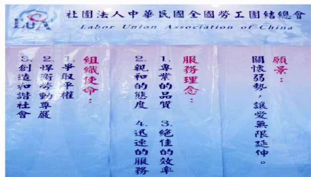
本會成立宗旨結合全方位完整的服務理念，達到關懷弱勢，讓愛無限延伸之永續經營目標！