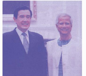
▲總統馬英九接見國際趨勢大師暨諾貝爾和平獎得主尤努斯，歡迎他來訪。

尤努斯說，如果世上沒有窮人，不用靠社會福利，大家都可自立自強，整個世界會越來越安全，「我們希望創造一個沒有貧窮的世界。未來甚至要打造一座貧窮博物館，因為人們只有到博物館才能看到窮人了！」