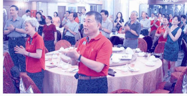
晚會最後在「我們都是一家人」大合唱的歡笑歌聲中圓滿落幕。