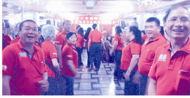
高市工總各治理事等列隊歡迎貴賓、優良會員前來參加表揚暨聯歡晚會活動。