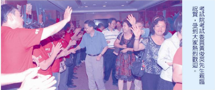
考試院考試委員黃俊英先生親臨祝賀，受到大家熱烈歡迎。