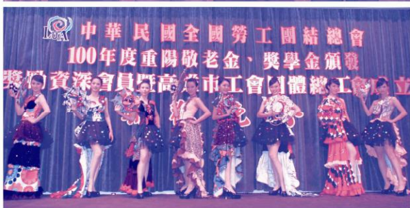
高雄樹德家商學校服裝設計科模特兒秀秀俐落帥氣的修身剪裁，搭配不同風格的風衣、針織外套或挺拔的西裝，更顯英倫紳士風範。