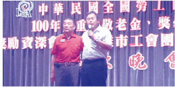
行政院勞工委員會 副主任委員潘世偉先生蒞賓張茂昌當選理事長並肯定為「打拚」。