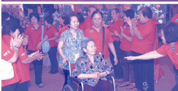
幹部組成歡迎隊伍，歡迎前來參加聯歡晚會會員、眷屬及各界貴賓。