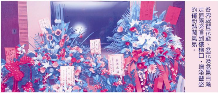
各界祝賀花籃、盆花及盆景白滿走道兩旁直到樓梯口，增添豐盛的繽紛熱鬧氣氛。