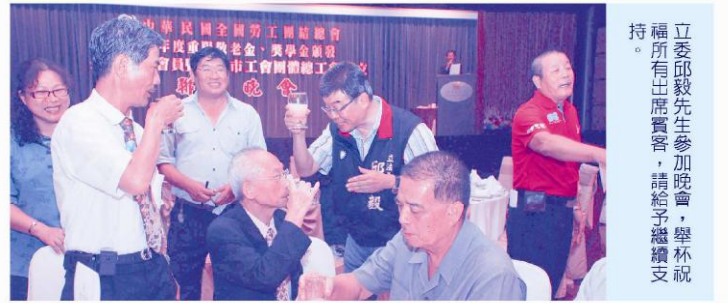
立委邱毅先生參加晚會，舉杯祝福所有出席賓客，請給予繼續支持。