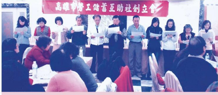
高雄市勞工儲蓄互助社當選幹部宣誓就職