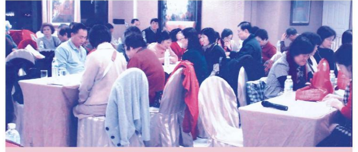
高雄市勞工儲蓄互助社社員參加創立會